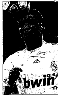
C. Ronaldo, anteayer.

A la espera de por quién se decante el técnico sevillano para dar un perfil más aguerrido o más ofensivo al once titular, todo apunta a que el equipo bilbaíno en Gijón será el conformado por Iraizoz, Iraola, San José, Amorebieta, Castillo; Susaeta o Gurpegui, Orbaiz, Javi Martínez, Gabilondo; Toquero y Llorente. Los jugadores están citados hoy en San Mamés para entrenarse a puerta cerrada.