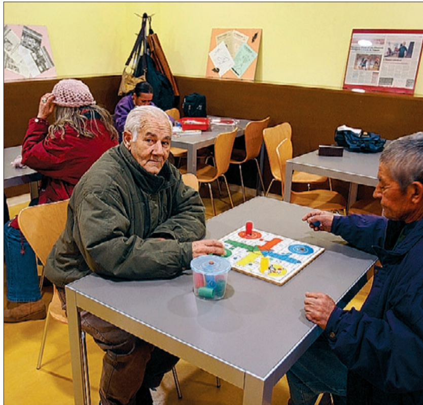
▶ Usuarios del centro municipal para 'sin techo' de la Meridiana, ayer.

Los responsables del local aseguraron que el centro será de «baja exigencia» y a él asistirán los indigentes