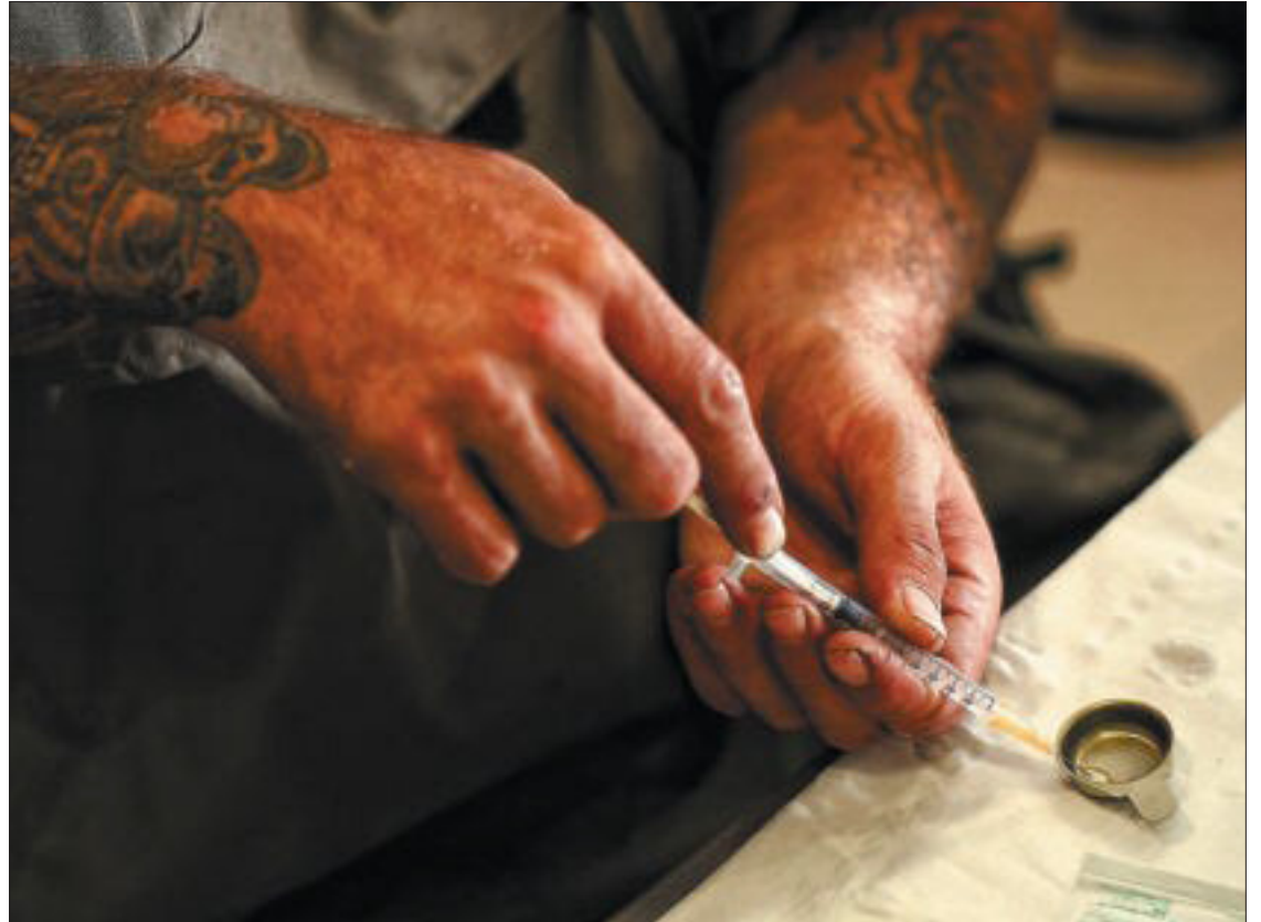
Un toxicómano preparando una dosis en la sala Baluard, en Ciutat Vella.

La concreción del plan de equipamientos establece dos tipos de centros: los estables y los activables en función de la demanda. Estos últimos estarán equipados para abrir si fuera necesario. “Hay que abrir los recursos allí donde hay demanda”, señalan fuentes conocedoras de la planificación. En esa premisa está de acuerdo la Federación de Asociaciones de Vecinos (FAVB). Su presidenta, Eva Fernández, considera que no tiene sentido diseminar los centros por toda la ciudad cuando hay una importante concentración de problemas de drogodependencias en Ciutat