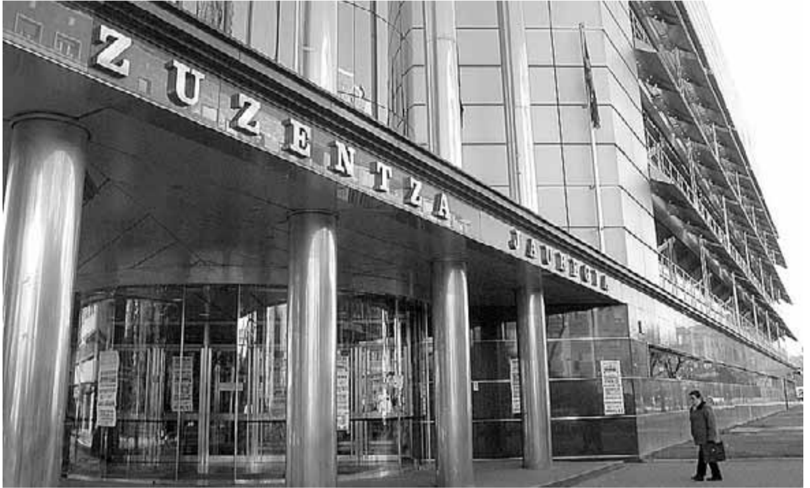
Exterior del Palacio de Justicia de Vitoria.

Asimismo, el Gobierno Vasco se compromete en dicho plan a promover, desde la competencia reguladora y planificadora, el desarrollo en el ámbito de protección a la infancia de programas integrales de intervención con adolescentes en situación de riesgo o desamparo.