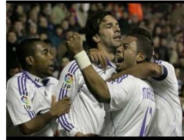
El Real Madrid tras ganar al Levante, afronta la segunda vuelta con los 7 puntos de ventaja