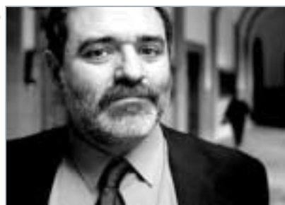
Maset impartió un seminario en la Universidad de Deusto.

Miguel Maset regresó a la 'narcosala' de Bilbao el pasado viernes. Había transcurrido algo más de un año desde que explicó a los vecinos de la calle Bailén cómo funcionaba un centro similar en Ginebra, ciudad suiza donde también dirige un programa para administrar heroína a 'yonquis' que no han conseguido 'desengancharse'. Partidario de las políticas de 'reducción de daños', el psiquiatra impartió el jueves y el viernes un cursillo especializado en la Universidad de Deusto. Aprovechó la ocasión para subrayar «el éxito» de la sala de consumo higiénico de Bilbao y anunció que el ensayo clínico de prescripción de heroína realizado en Granada también ofrecerá resultados «fantásticos».